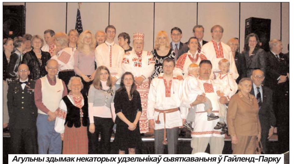
Агульны здымак некаторых удзельнікаў сьвяткаваньня ў Гайленд-Парку