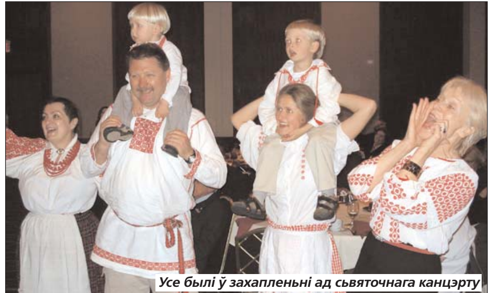
Усе былі ў захваленьні ад сьвяточнага канцэрту