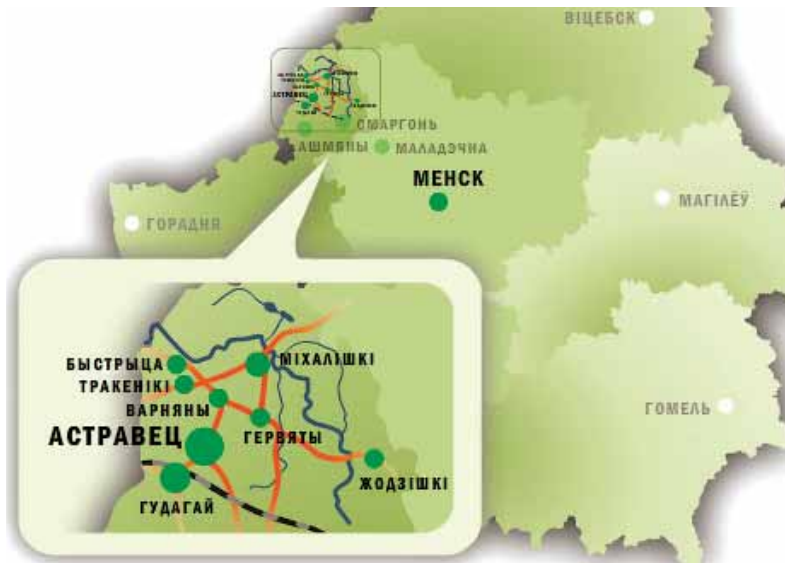
Будаўніцтва АЭС пачалося ў адным з экалагічна найчысьцейшых куткоў Беларусі, каля Астравца ў Гродзенскай вобласьці.

дэпутат Вярхоўнага Савета Рэспублікі Беларусь 12 скліканьня Лістапад 2011 г.