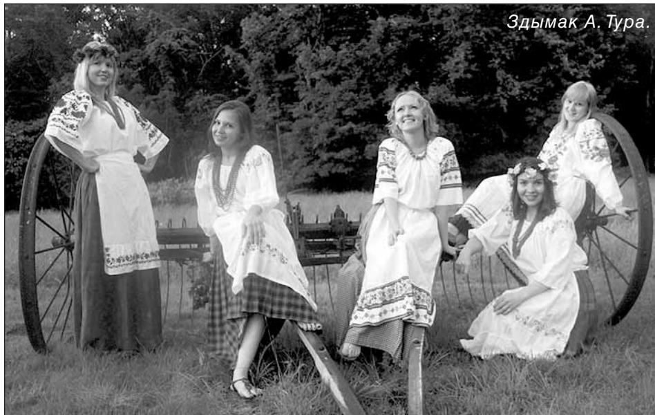
Здымак А. Тура.

Пакуль гулялі ў розных гульні, нехта пастараўся скрасыць Купалінку. Але Купаліш з годнасьцю вярнуў яе да вогнішча і купальшчыкаў. Вялікаю папулярнасьцю карысталася гульня ў Цяцерку, калі пад песню: "Я цяцерку пасу – вух я! На зялёным лугу – вух я! Я цяцерку за хвост – вух я! А цяцерка пад мост – вух я!" Хлопец, ідучы звонку, праводзіў дзяўчыну між калёнамі хлопцоў і дзяўчат, а ў канцы калёны яна вырывалася і ўцякала, а задача хлапца была злавіць сваю цяцерку, каб ва ўзнагароду атрымаць пацалунак.