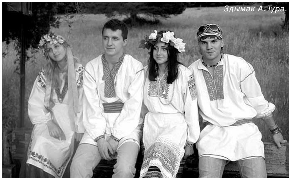
Здымак А. Тура.

паліўшы яе, разам з Купалінкаю ўдвох яны распалілі купальскае вогнішча. І даволі такі вялікі карагод нясьпешна рушыў па ходу сонца зь песняю: "А ў нас сеньня – Купалачка, а ў нас заўтра – Іванічка". Потым прагучэла: "Хадзіў чыжык па вуліцы, клікаў дзевак на Купальле". Было прыемна, што ўсе старанна і зычна спявалі за мною сьледам, бо я, як заўжды, была запявалаю. Лялька Мара, якая гэтым разам была сымболом зла, атрымалася вельмі прыгожаю. Але, ня глядзячы на гэта, яе ўрачыста спалілі пад карагод: "Ня дзеўка агонь клала, сам Бог агонь раскладаў, усіх сьвятых да сябе зваў."