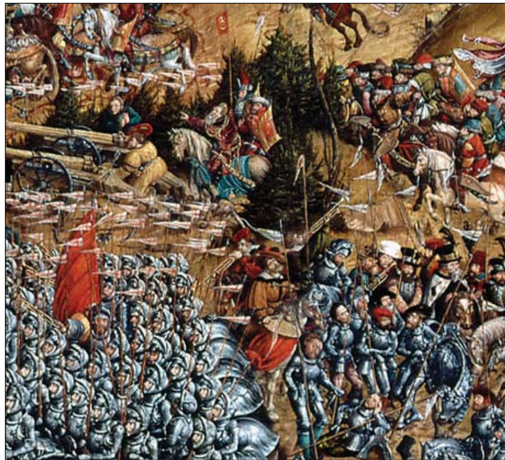
Фрагмэнт карціны невядомага мастака “Бітва пад Воршай”.

Традыцыя адзначэньня Дня Беларускай Вайсковай Славы адносна новая, бо толькі з дасягненьнем незалежнасьці адкрылася магчымасьць спасьцігаць сваю