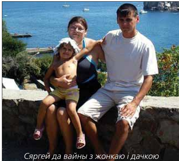
Сяргей да вайны з жонкаю і дачкою

(паводле газэты “Сёгодня” ад 5 сьнежня 2014 г.)