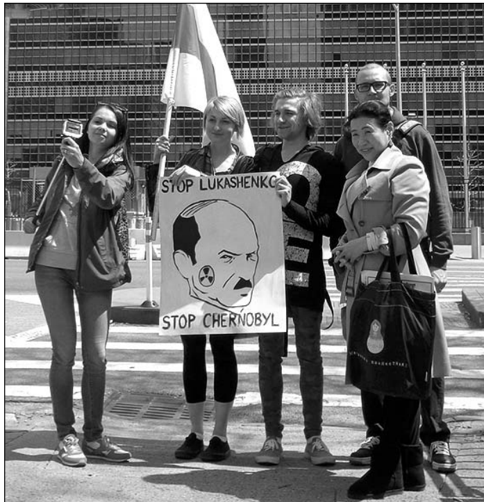
Мары Асана з удзельнікамі мітынгу

нем дапамогі й ільготаў для жыхароў. Яшчэ раней былі амененыя ільготы для ліквідатараў, тых хто браў удзел у працах па дапамозе ліквідацыі наступстваў аварыі ў непасрэднай блізкасьці да рэактару і ў зонах з высокім узроўнем радыяцыі.