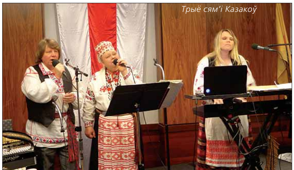
Трыё сям’і Казак