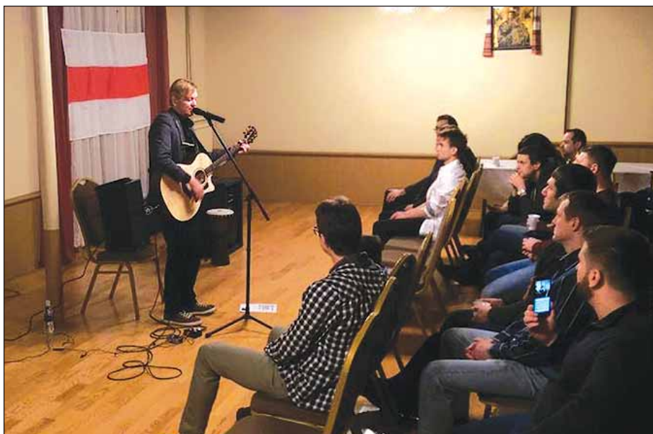
Канцэрт у Чыкага