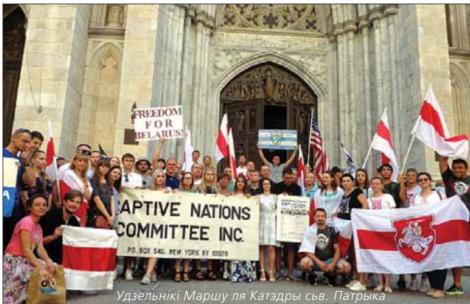
Удзельнікі Маршу ля Катэдры сьв. Патрыка