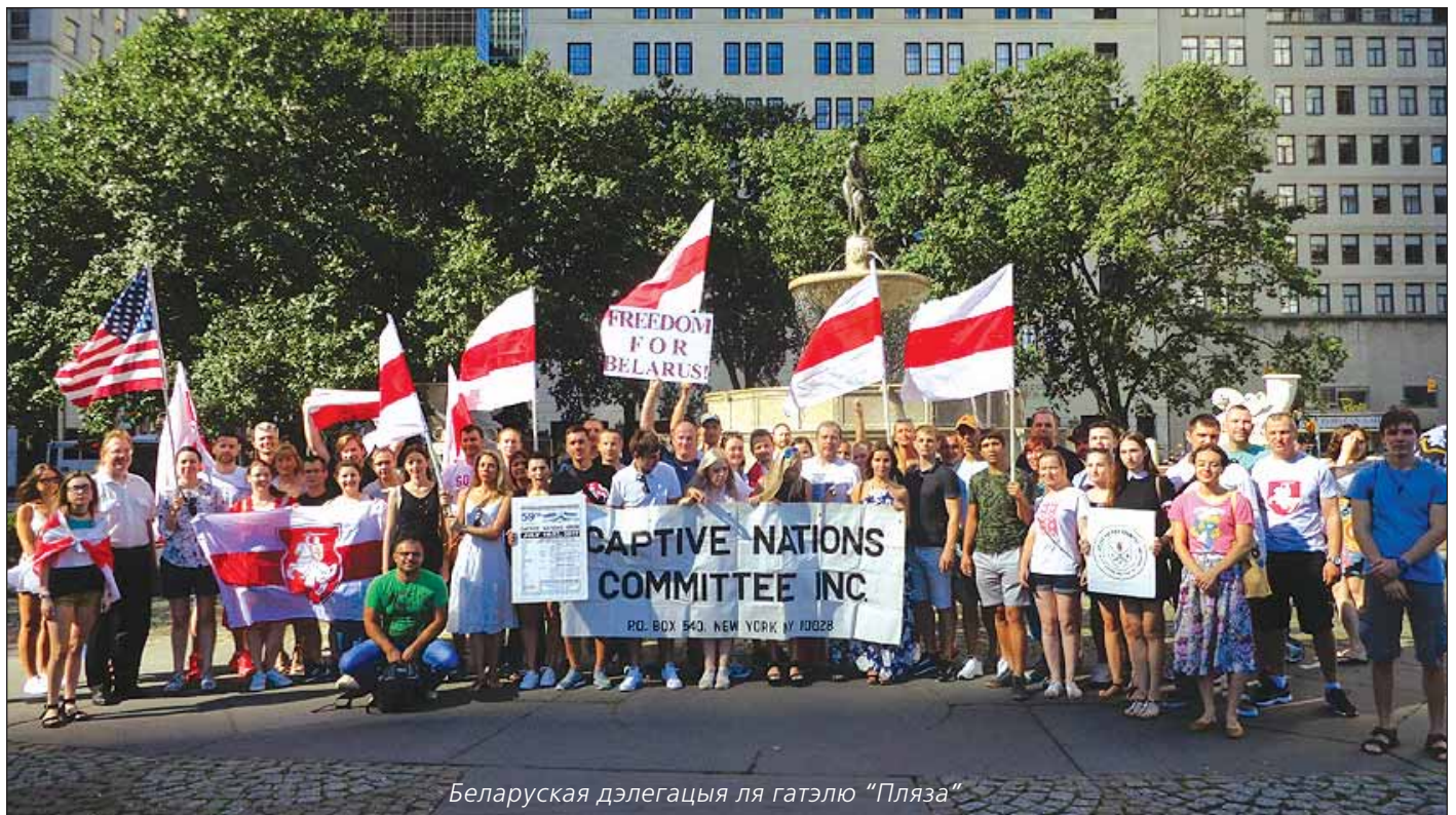
Беларуская дэлегацыя ля гатэлю “Пляза”